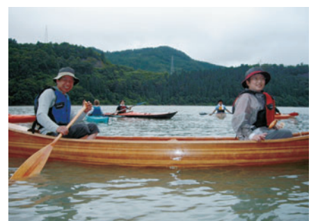
ご夫婦で楽しむカヌー

社長が若い頃からいつか作りたいことを夢見ていたというカヌー作りであったが、ある新聞記事でカヤックを手作りする記事を目にしてから、奥さんも協力を以て木製カヌー手作りプロジェクトが始動した。カヌー本体は、本業で培った技術を活かして、杉板を湾曲させながら木目の美